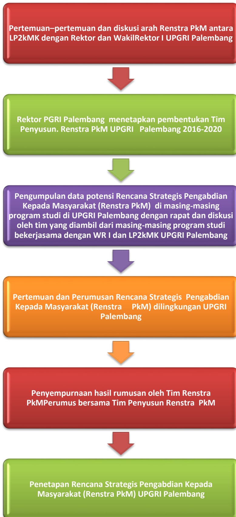
Gambar 1. Langkah-langkah Penyusunan Renstra PkM UPGRI Palembang